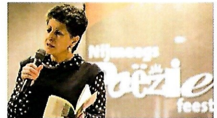
Amal Poëziefeest 2015

Nu denk, praat, droom en schrijf ik in het Nederlands. Mijn eerste dichtbundel is net uit. Die is ook vertaald in het Arabisch. Want dat blijft altijd de taal van mijn hart.’